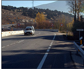
Un vehiculo parado en la N-110 da su intermitente derecho para entrar en Sigüero.